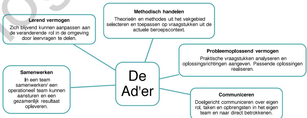
Figuur 1 Beschrijving niveau 5

De Associate degree-afgestudeerde wordt gekenschetst als een verbinder . De beschrijving van niveau 5 verwoordt het als volgt: